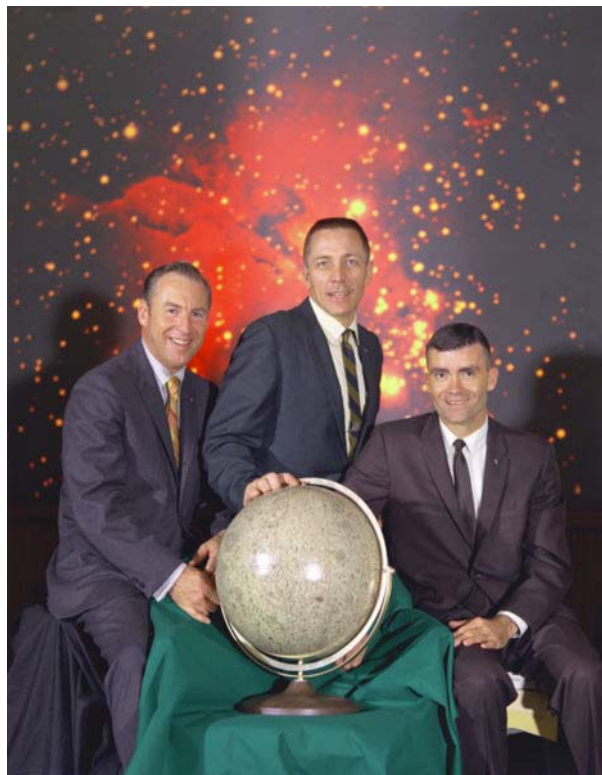
Tripulación del Apolo 13

El Apolo 13 fue una misión espacial que tenía como misión alunizar en la región Fra Mauro, pero una explosión a bordo de la nave en su camino a la luna obligó a la tripulación a abortar la misión y orbitar alrededor de la Luna sin lograr su cometido de llevar al quinto y al sexto ser humano a la superficie lunar.