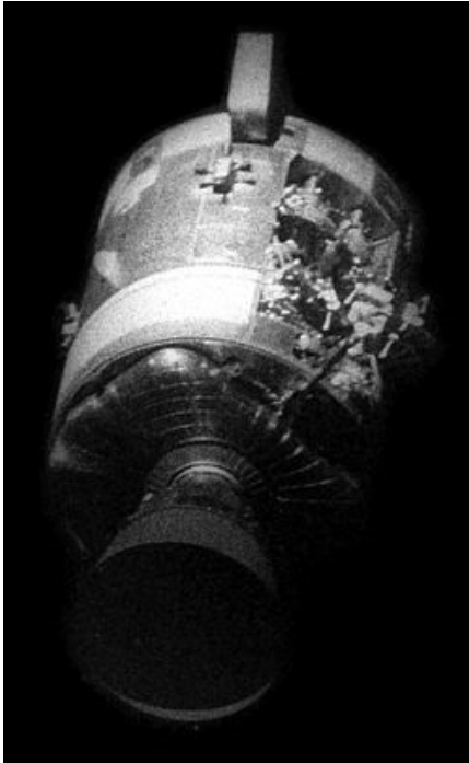
Daños en el Apolo 13

En el lugar de la zona dañada por la explosión se mostraban gravemente afectada. Entonces cundió el pánico entre los controladores especulando sobre la integridad del escudo de protección térmica del módulo de comando al ingresar a la atmosfera, pero era un riesgo que había que correr.