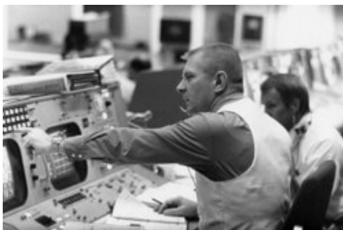
El director de vuelos Gene Kranz

En el lugar de la zona dañada por la explosión se mostraban gravemente afectada. Entonces cundió el pánico entre los controladores especulando sobre la integridad del escudo de protección térmica del módulo de comando al ingresar a la atmosfera, pero era un riesgo que había que correr.